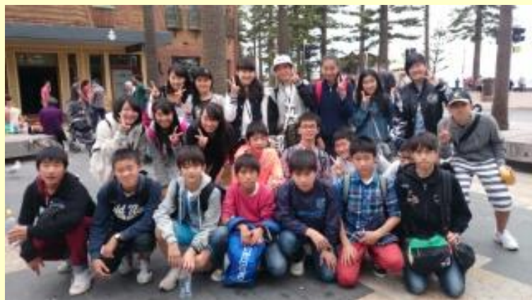
■307 マンリービーチ 今から解散。その前に集合写真！