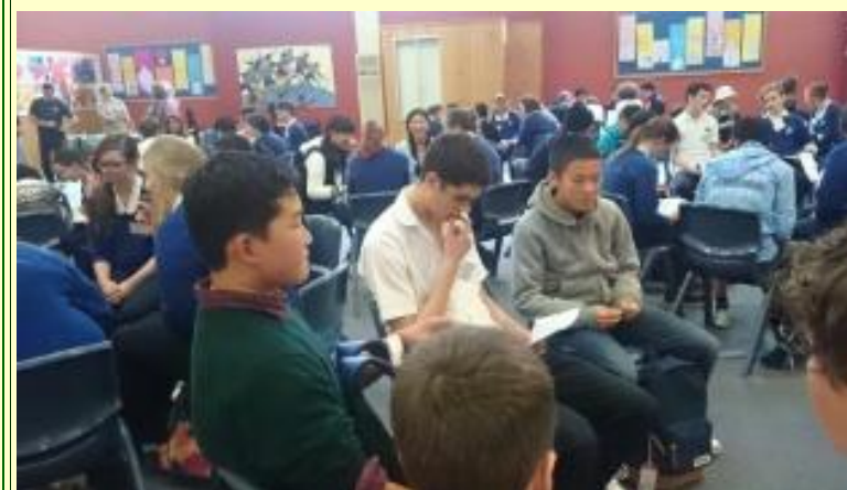
■85 あ！ 固まってる(15/11/04 13:41)