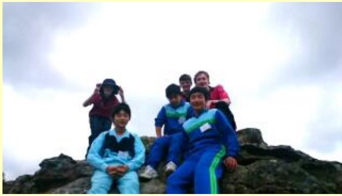
■171 ハンドボール (15/11/06 8:21)