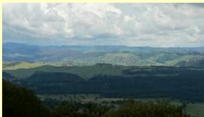
■199 ウォーキング このながめをみえています。