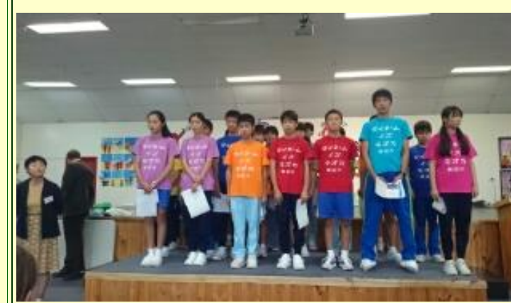
■222 修了証書 団長からお礼の言葉