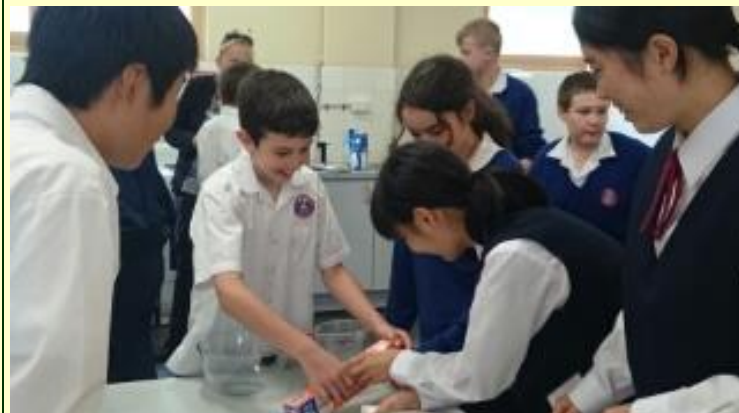
■132 クッキー作り (15/11/05 11:16)