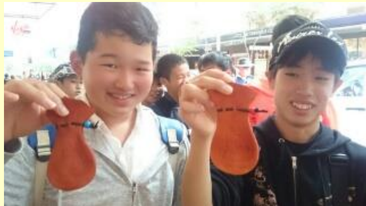
■324 こ、これは... カンガルーの... です