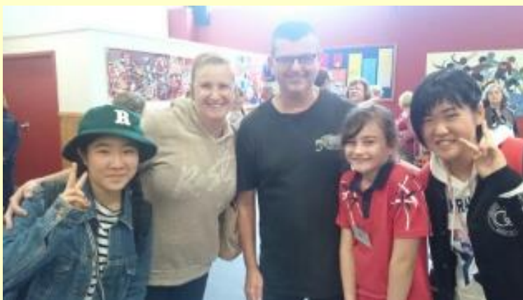
■87 いよいよ ホストファミリーのお宅へ(15/11/04 13:47)