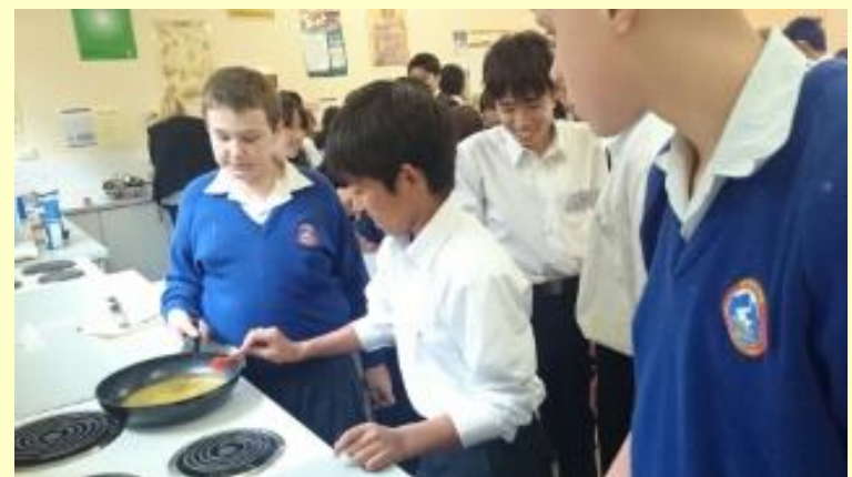
■139 クッキー作り バターを溶かします(15/11/05 11:36)