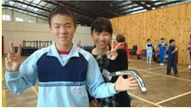
■177 モーニングティー (15/11/06 8:34)