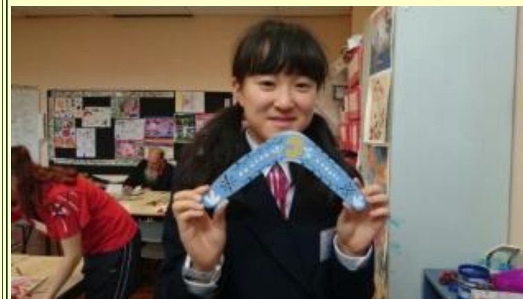
■209 ブーメラン 優しい色ですね