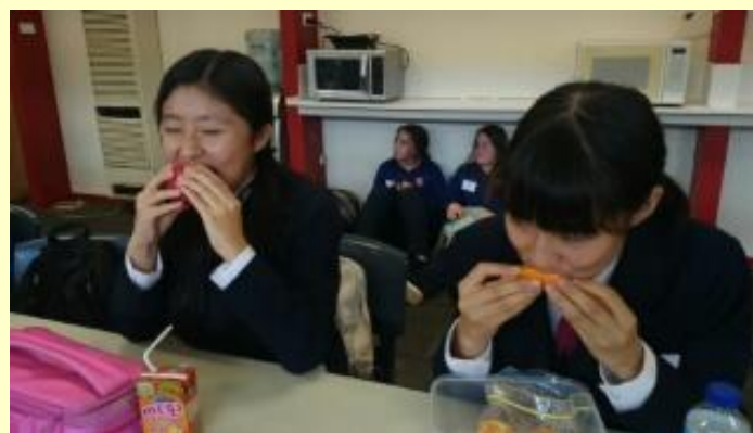
■149 ランチタイム りんごは丸かじり～(15/11/05 12:09)