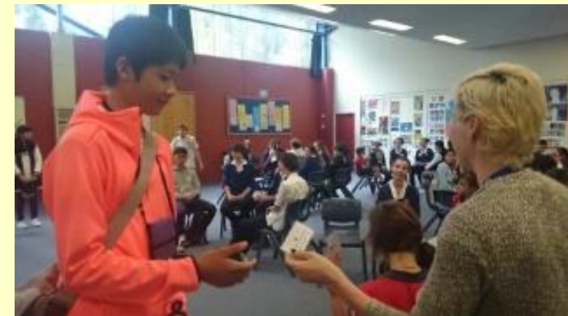
■78 先生から 名札をいただきました(15/11/04 13:35)