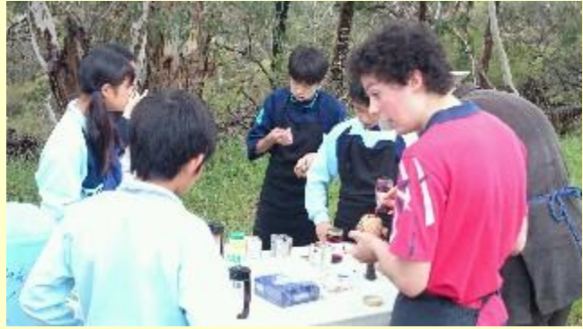
■176 モーニングティー