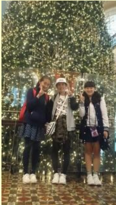
■321 クリスマスツリー