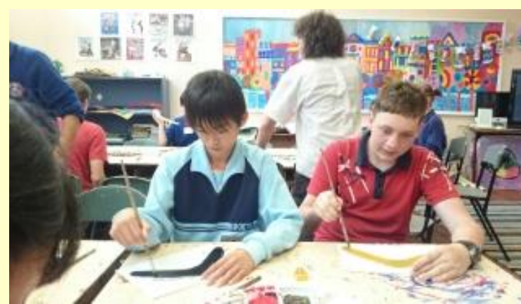
■201 アボリジナル アート ブーメラン作り