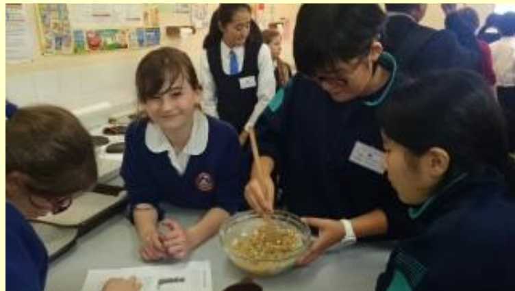
■137 クッキー作り (15/11/05 11:33)