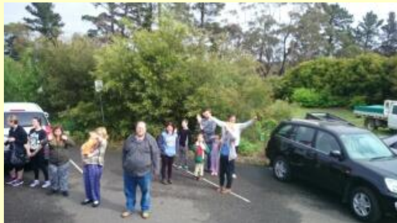
■300 出発 (15/11/08 7:28)