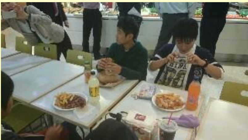
■72 学校へ (15/11/04 10:52)