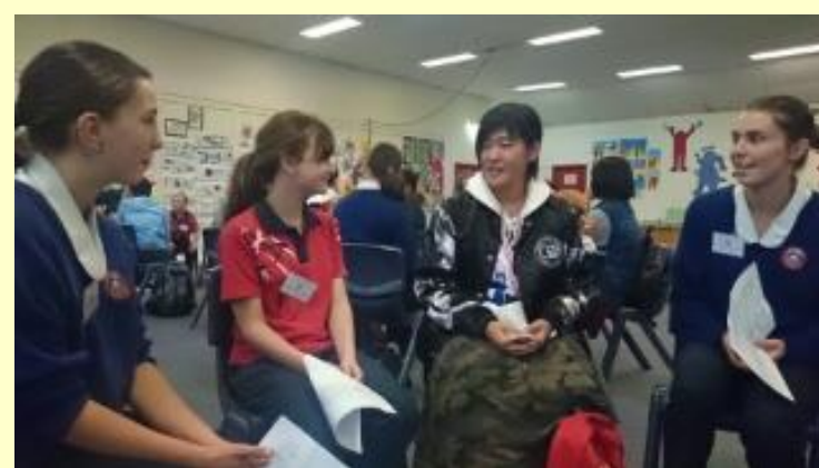
■80 アイスブレイク (15/11/04 13:37)