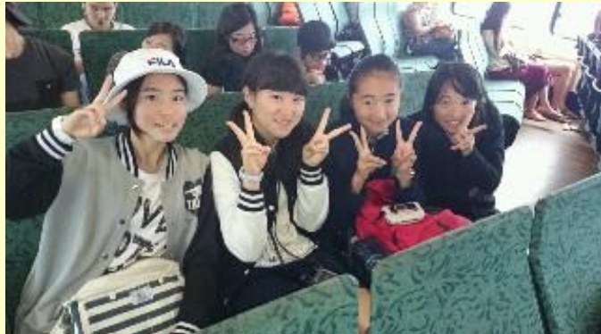
■304 Fwd: フェリー