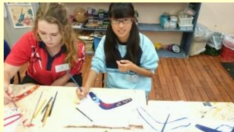
■200 ブーメラン まもなく完成。なかなかのできばえですね。