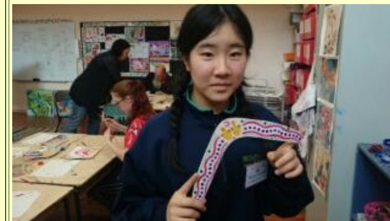
■210 ブーメラン 女の子らしい色です！