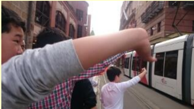
■325 偶然 路面電車が来ました。(15/11/08 15:43)