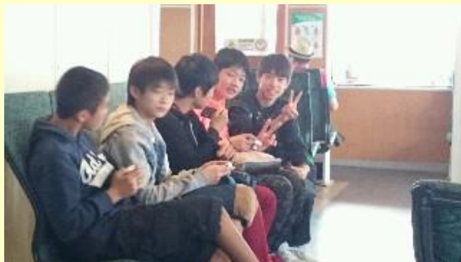
■303 フェリーに乗っています (15/11/08 9:53)