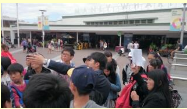
■306 マンリービーチ到着 (15/11/08 10:09)