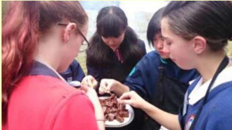
197 最後は カンガルーのお肉の BBQ