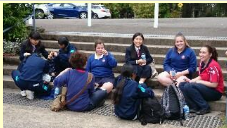
■215 団らん ピサで昼食です。(15/11/06 10:57)