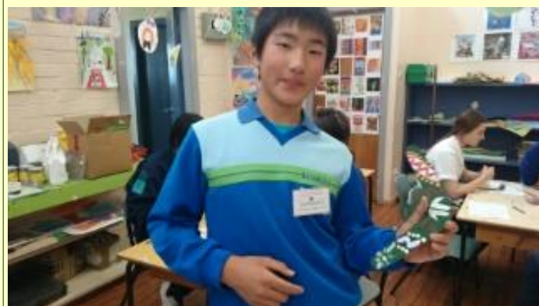
■207 ブーメラン 出来ました！