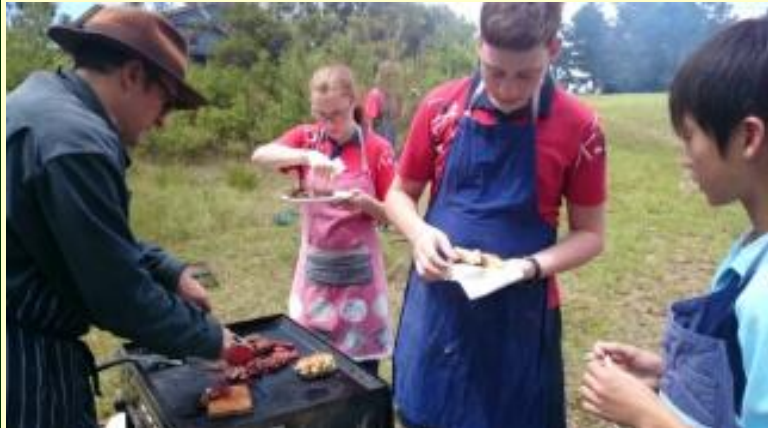
194 ブッシュクッキング カンガルーのお肉～