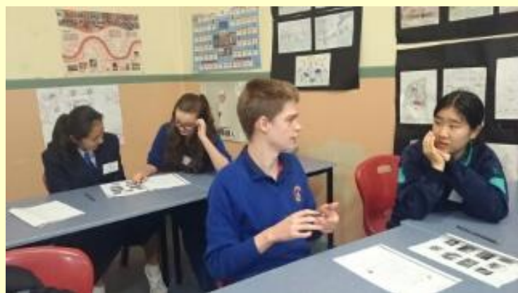
■123 英語の授業 (15/11/05 8:39)