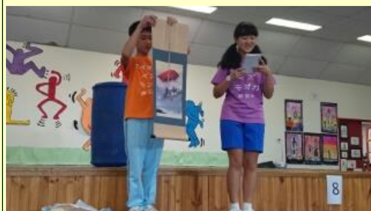
■224 プレゼント 掛軸の説明