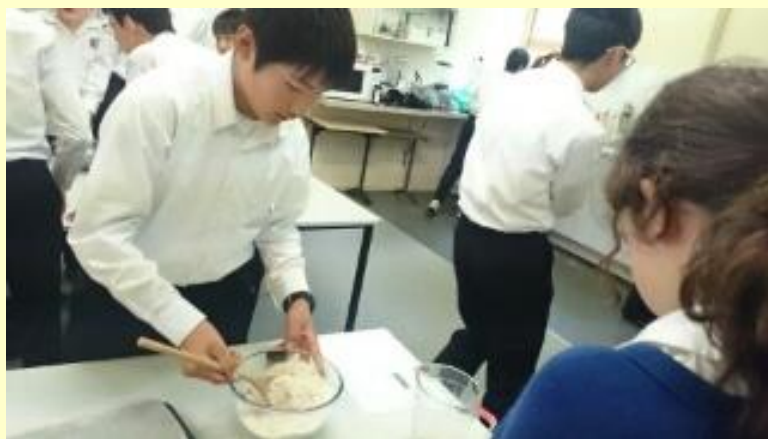
■135 クッキー作り (15/11/05 11:31)