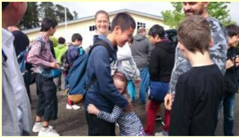
■296 ありがとう！ 妹ができました！