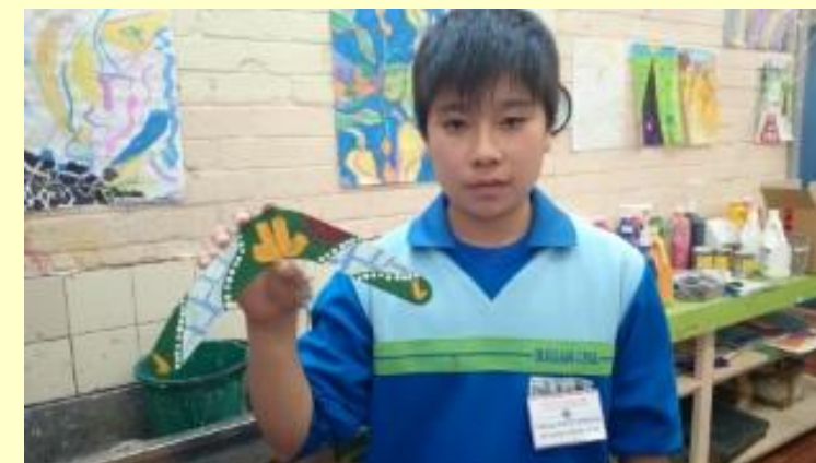
■206 ブーメラン 出来上がり！