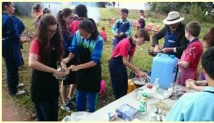
■172 野外活動 (15/11/06 8:25)