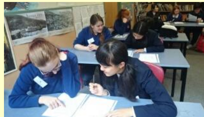
■129 英語の授業 (15/11/05 9:05)