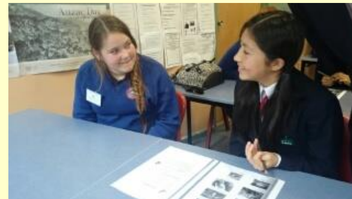
■125 英語の授業 (15/11/05 8:43)