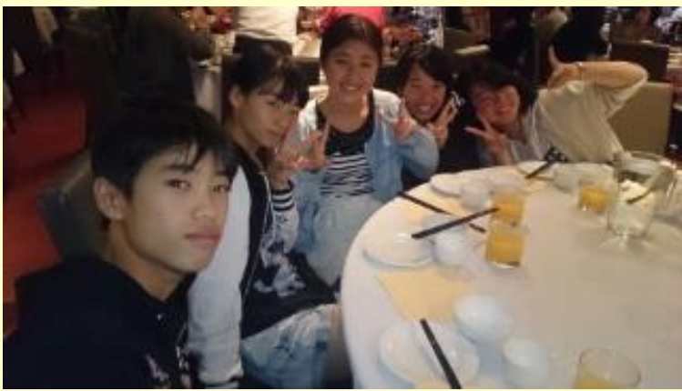
■326 最後の夕飯 中華です(15/11/08 16:07)