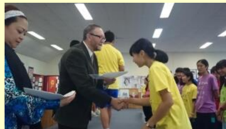
■217 修了証書 (15/11/06 12:45)