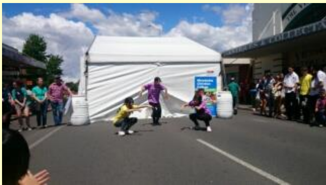
■283 ステージ！ 路上パフォーマンス！まずはヒップホップの披露。拍手喝采！