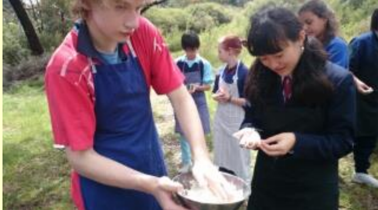
185 ブッシュクッキング どう？