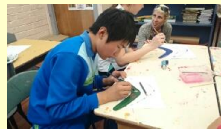
■202 ブーメラン作り (15/11/06 10:01)