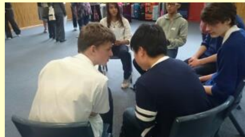
■86 聞き取れないなら 顔を近づけて(15/11/04 13:41)