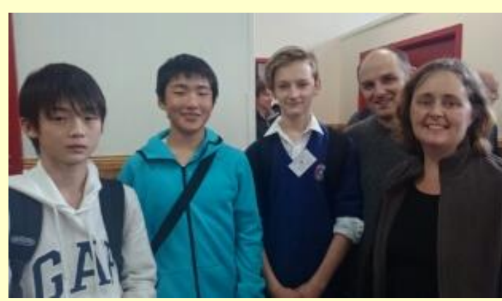
■89 いよいよ ホストファミリーのお宅へ