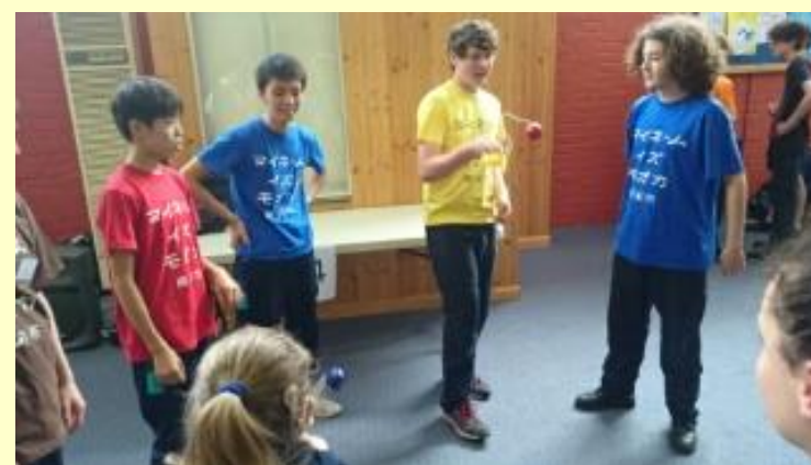
■237 けん玉 一緒にやりました(15/11/06 13:50)