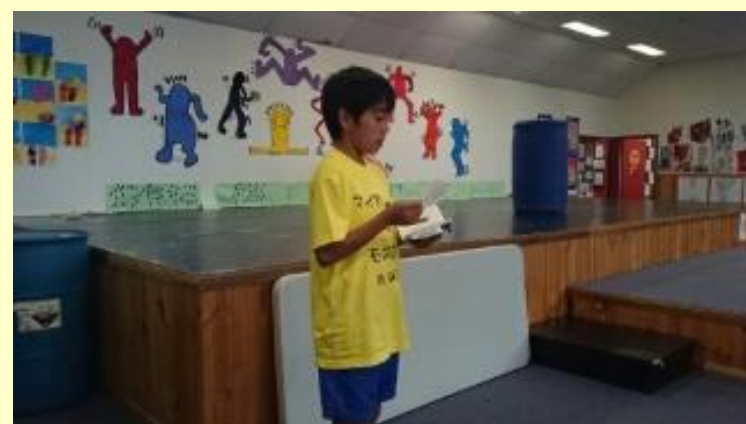
■223 交流会 司会の大役です(15/11/06 12:48)