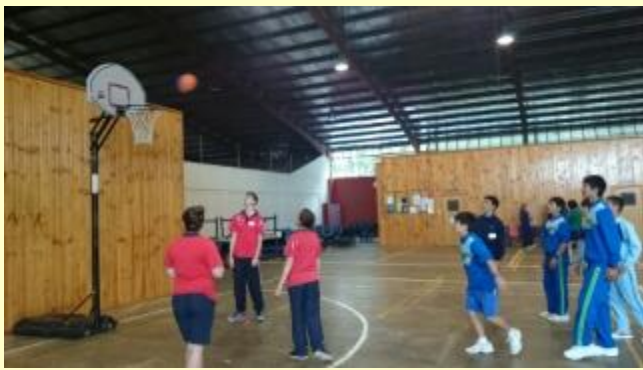
■182 ブッシュクッキング (15/11/06 8:59)