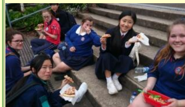
■213 フェアウェルランチ (15/11/06 10:44)