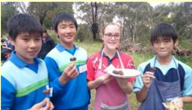
195 カンガルーのソーセージ！