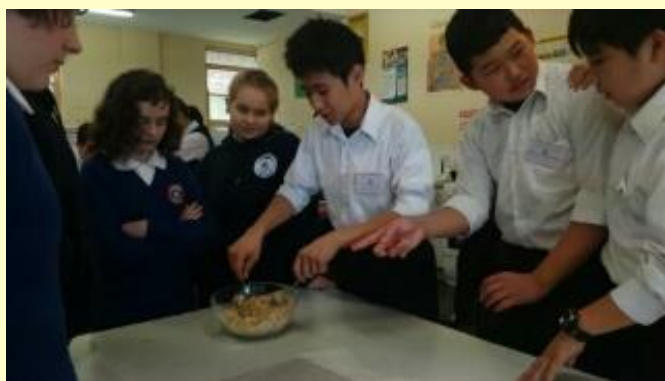
■143 クッキー作り 固まる？(15/11/05 11:43)