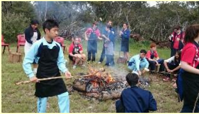
■173 アボリジニアート (15/11/06 8:27)