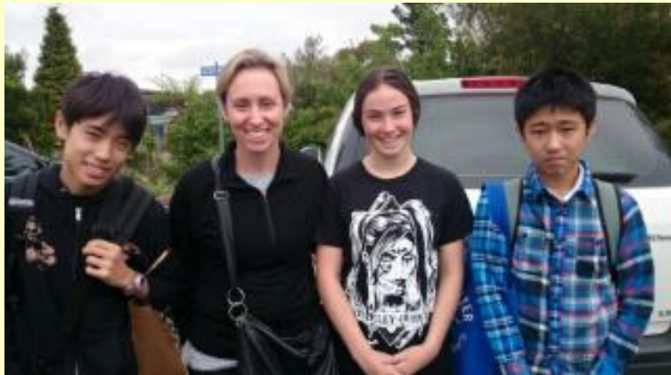
■288 お別れです (15/11/08 7:17)