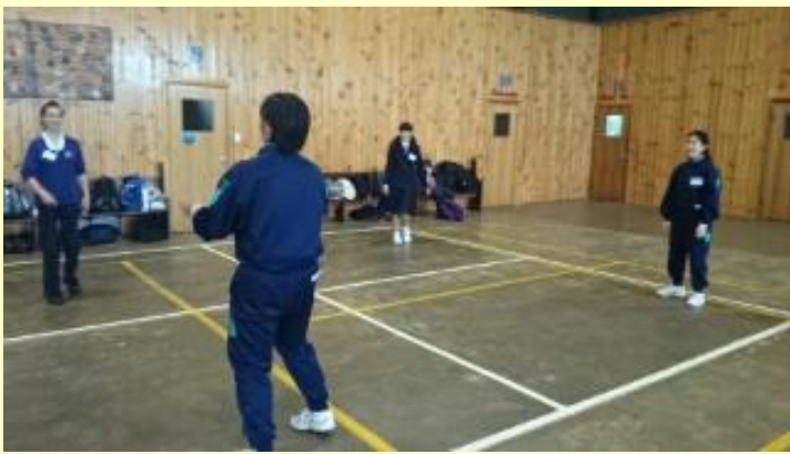
■175 モーニングティー (15/11/06 8:32)