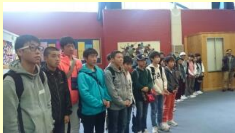
■75 いよいよ スクールに着きました(15/11/04 13:29)