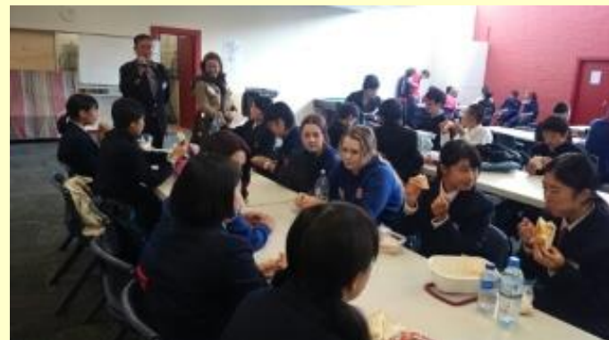
■146 ランチタイム (15/11/05 11:59)