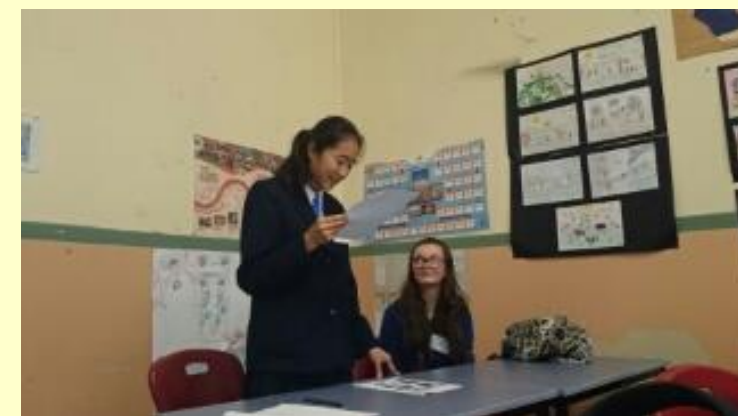
■126 英語の授業 (15/11/05 8:46)