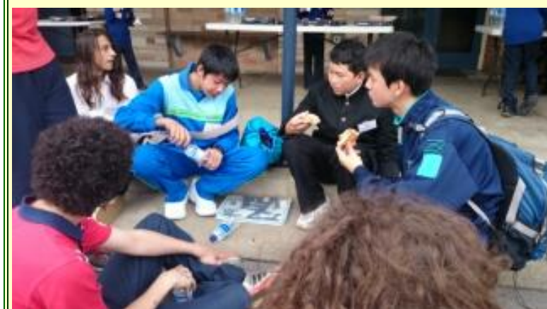
■211 フェアウェルランチ！ (15/11/06 10:43)