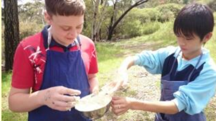
184 ブッシュクッキング ベタベタになっちゃった！