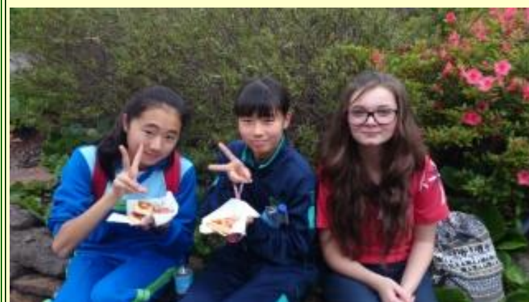
■212 フェアウェルランチ (15/11/06 10:44)