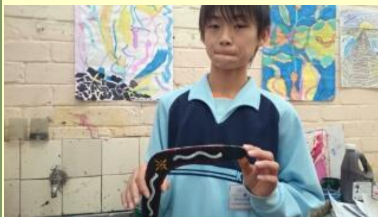
■208 ブーメラン 出来ました！