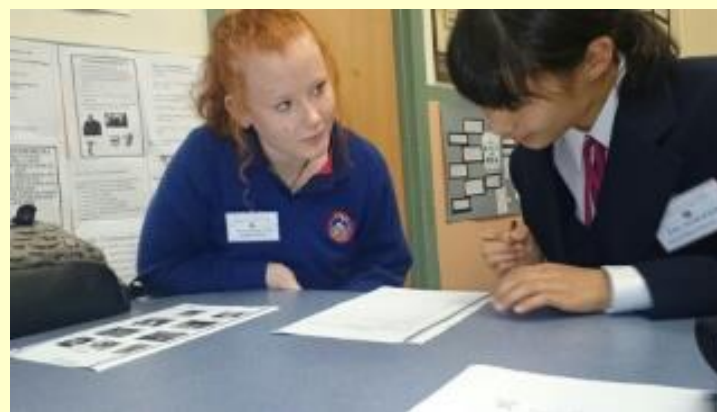
■128 英語の授業 (15/11/05 9:02)