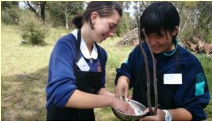
183 ブッシュクッキング 混ぜ混ぜ(15/11/06 9:01)