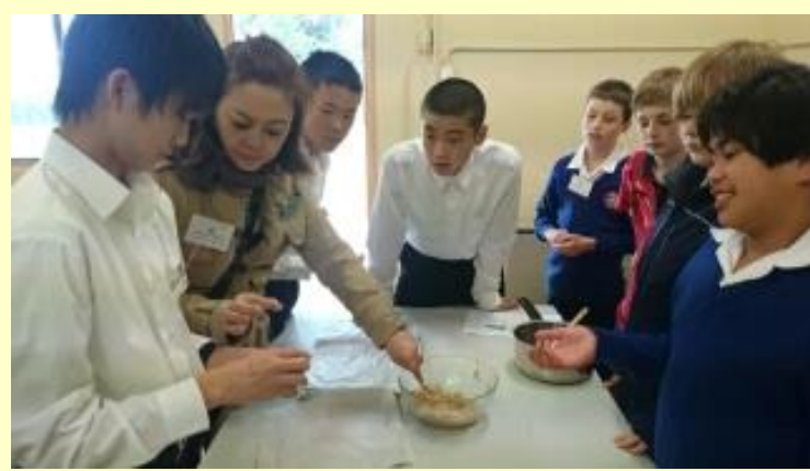
■142 クッキー作り やっとここまで来た！(15/11/05 11:41)