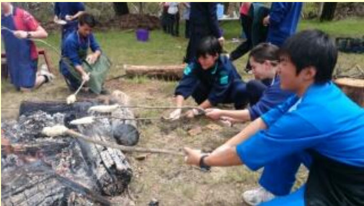
191 ブッシュクッキング がんばって！