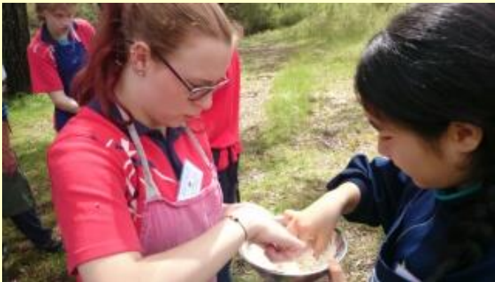
187 ブッシュクッキング もっと小麦粉が必要ね