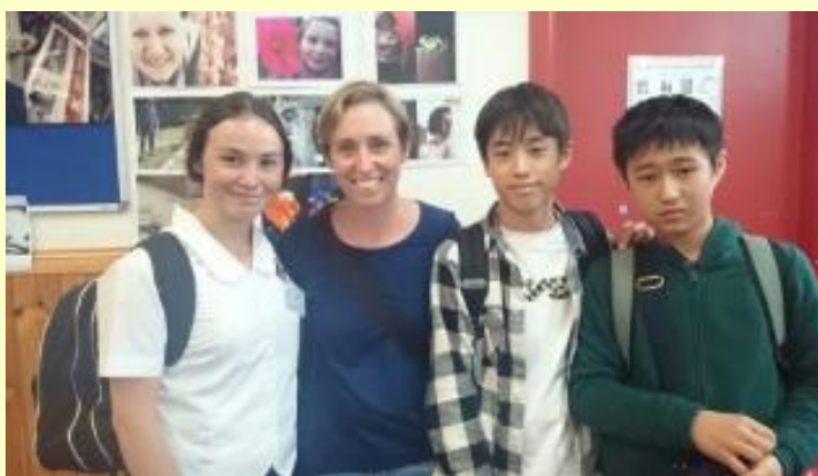
■88 いよいよ ホストファミリーのお宅へ