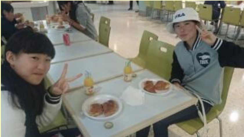
■70 ランチ デニッシュ