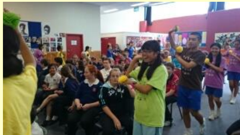
■231 日光和楽躍り (15/11/06 12:54)