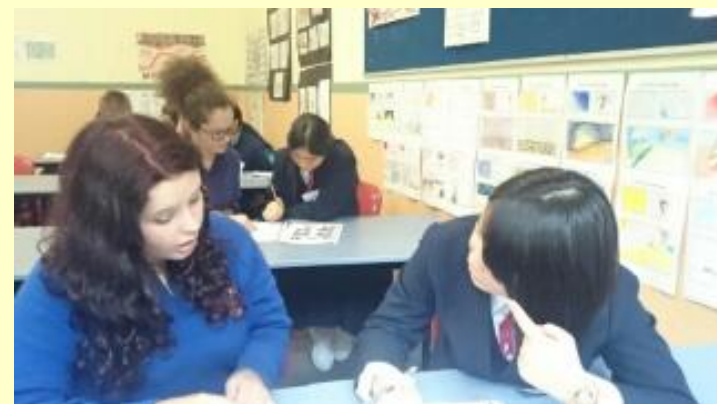
■124 英語の授業 (15/11/05 8:42)