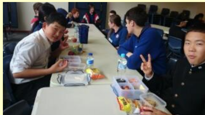
■148 ランチタイム (15/11/05 12:04)