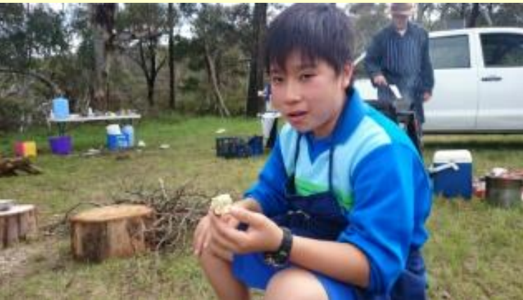
192 ブッシュクッキング ん！おいしいよ！