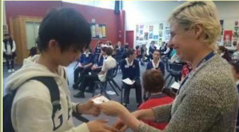
■76 先生から 名札をいただきました(15/11/04 13:30)