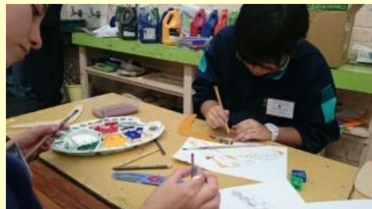
■204 ブーメラン作り (15/11/06 10:02)