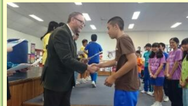
■218 修了証書 (15/11/06 12:46)