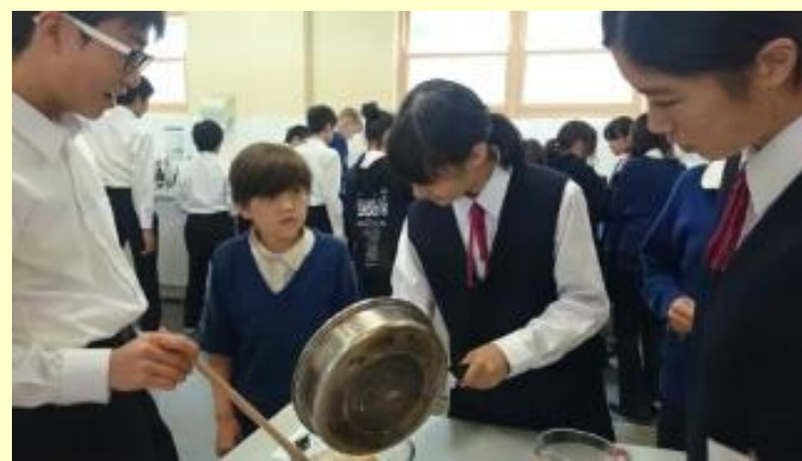
■136 クッキー作り (15/11/05 11:32)