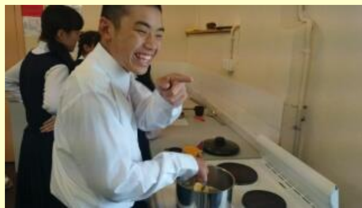
■138 クッキー作り バターを溶かします (15/11/05 11:35)