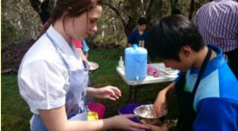
186 ブッシュクッキング いい感じ