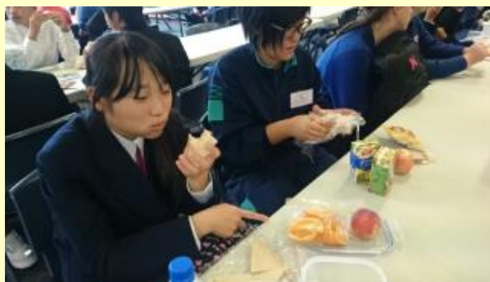
■147 ランチタイム (15/11/05 12:01)