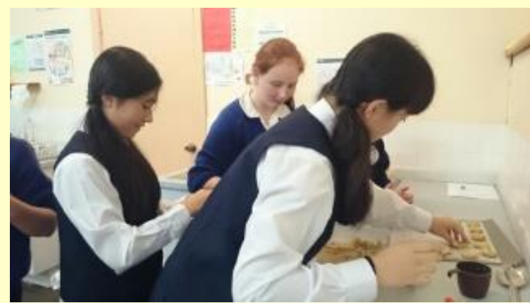
■141 クッキー作り 順調！(15/11/05 11:40)