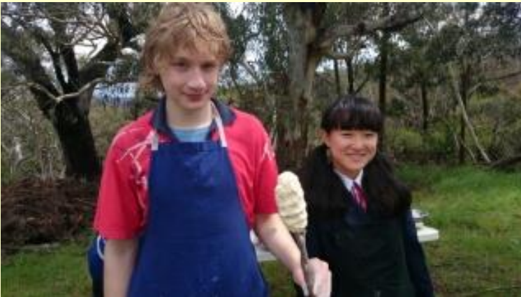
188 ブッシュクッキング 今から焼きまーす