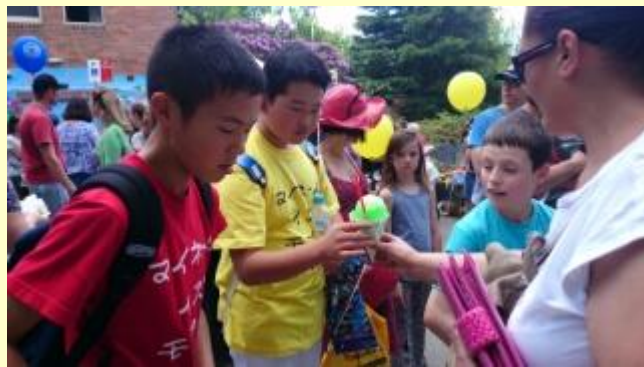
■281 メイン通り かき氷～