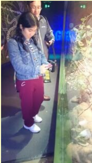
■63 あ！かわいい 日本にはいないね (15/11/04 9:49)