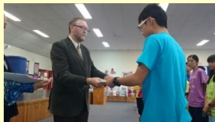
■216 修了証書一人ずついただきました。(15/11/06 12:45)