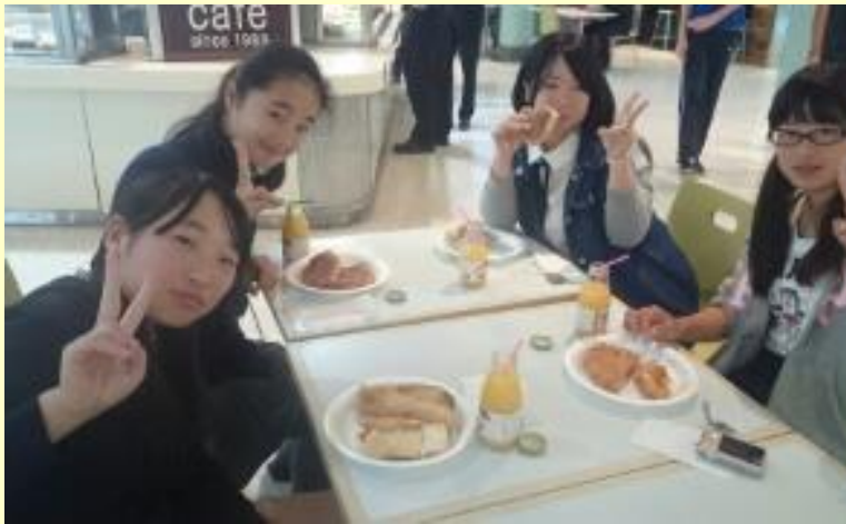
■69 女子は デニッシュ