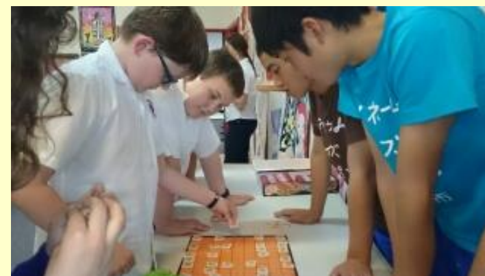
■238 将棋 (15/11/06 13:56)