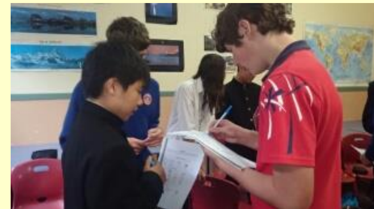
■122 英語の授業 (15/11/05 8:36)