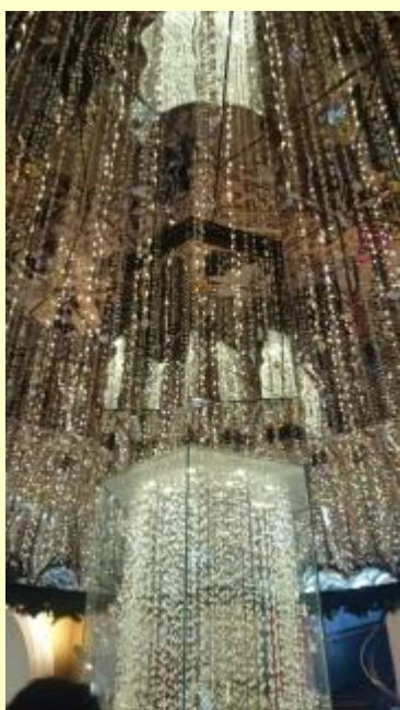
■318 スワロフスキーのクリスマスツリー