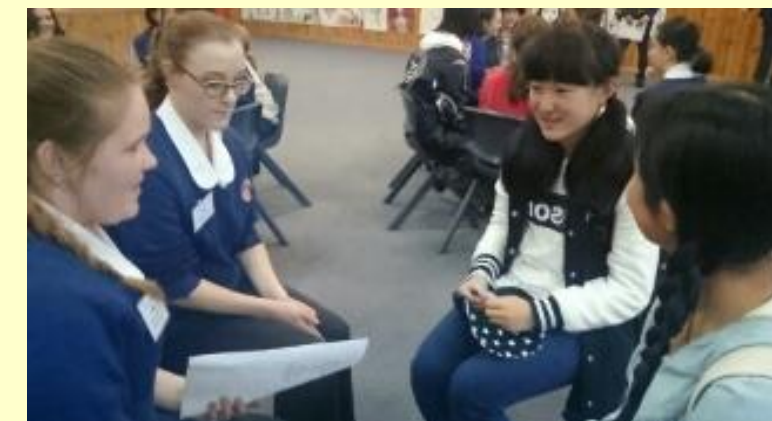
■82 緊張 自己紹介(15/11/04 13:38)