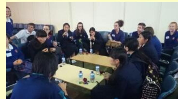
■130 モーニングティー (15/11/05 9:13)