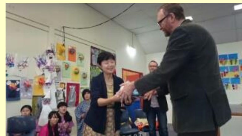
■236 プレゼント引率者もプレゼントをいただきました