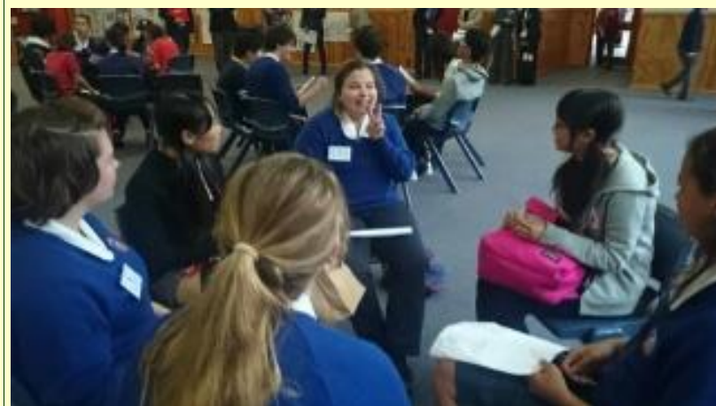
■83 ありがたいことに 元気なバディです