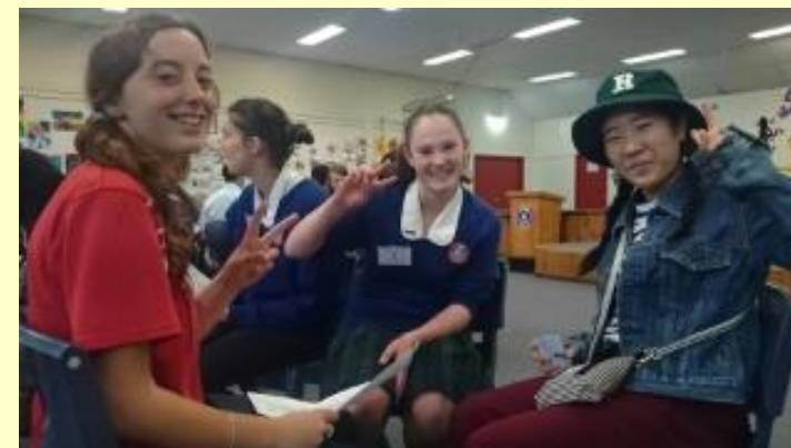
■81 アイスブレイク バディに自己紹介