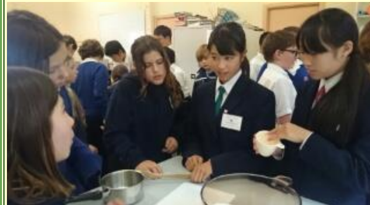
■133 クッキー作り レシピも当然英語！