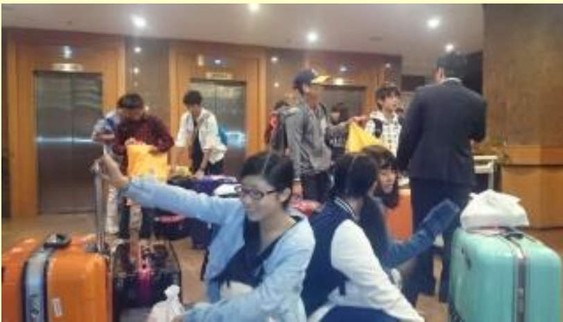
■345 続々と集まってきました(15/11/09 3:30)