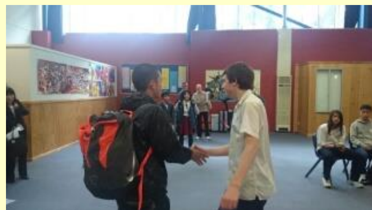
■79 ご対面 バディです (15/11/04 13:36)