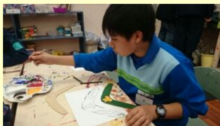
■203 ブーメラン作り (15/11/06 10:01)