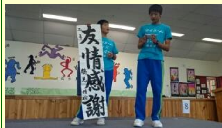
■225 プレゼント 素晴らしいお習字