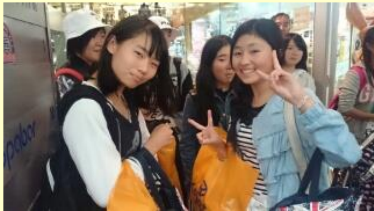
■323 お買い物 (15/11/08 14:18)