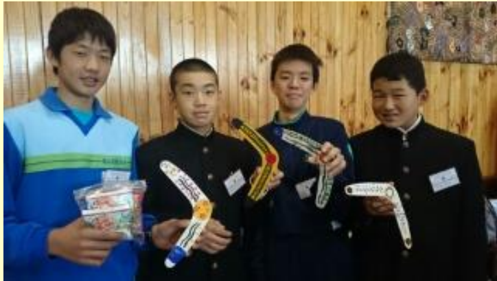
■178 やっぱり (15/11/06 8:37)