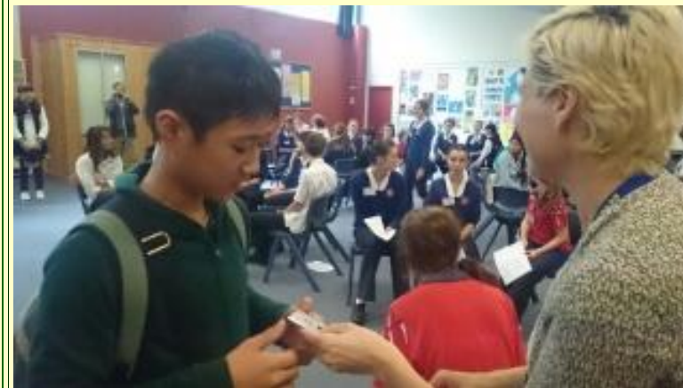
■77 先生から名札をいただきました(15/11/04 13:34)