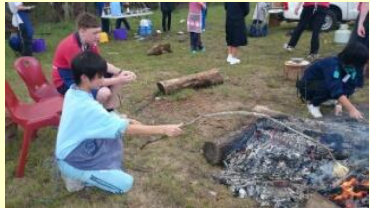
193 ブッシュクッキング 煙いっ！