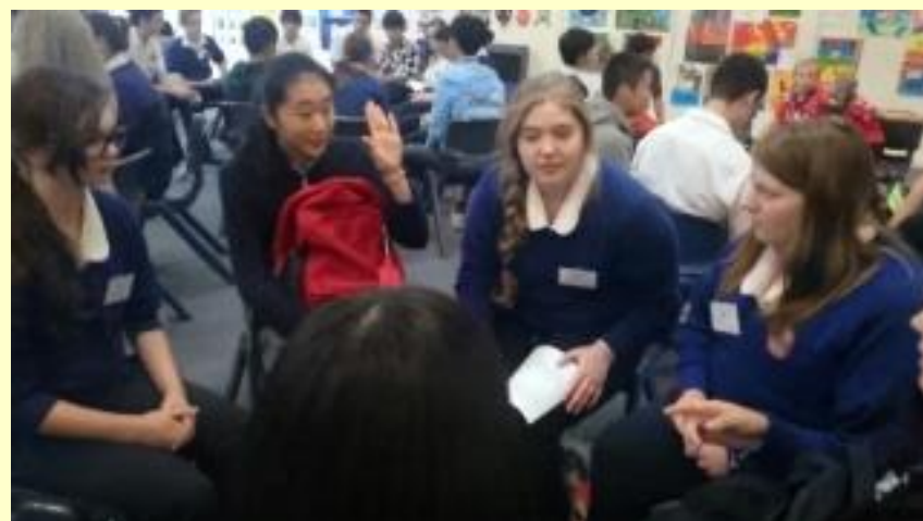
■84 せっかくだから 自分から話します！(15/11/04 13:40)