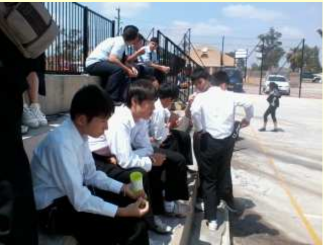
■120 モーニング・ティー