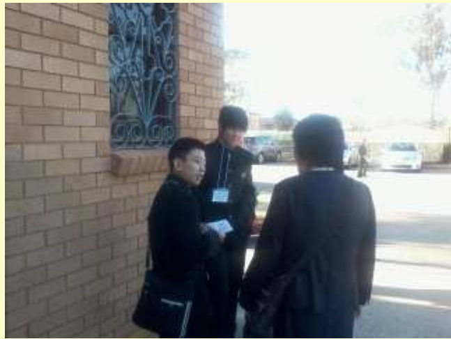
■55 2日目 生徒登校