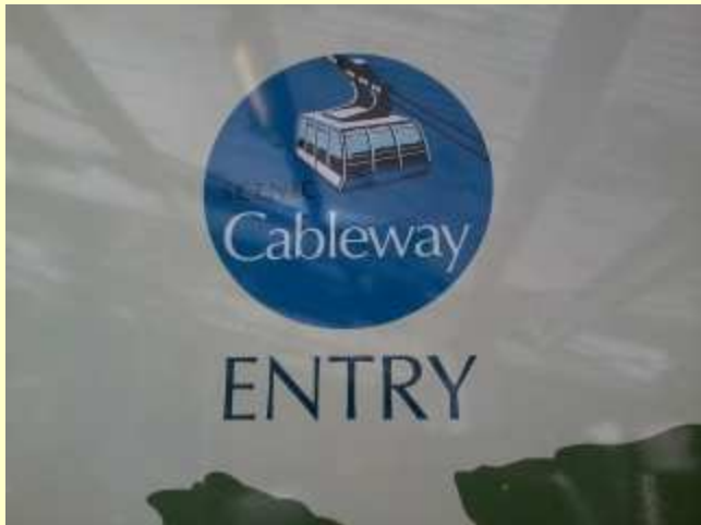
■210 ロープウェイにものりました。