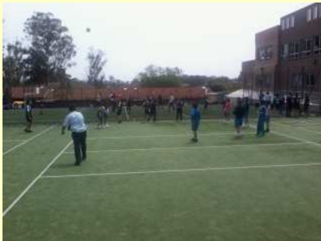
■130 お昼は、現地校の生徒と。