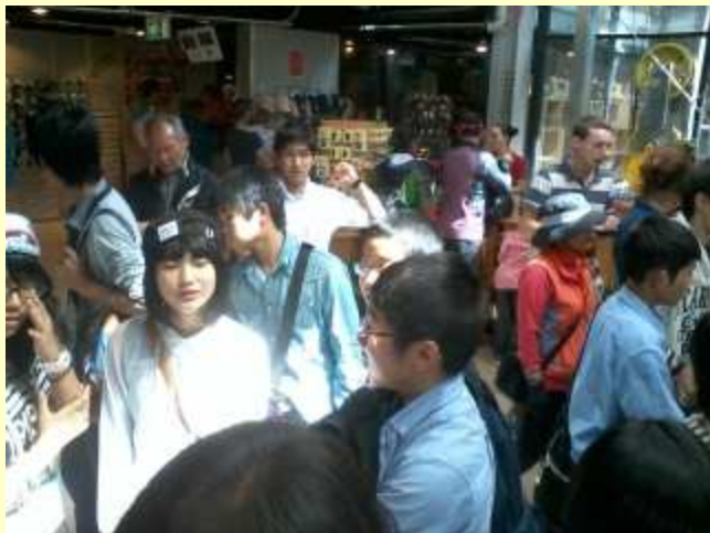
■214 お土産を買ってます。