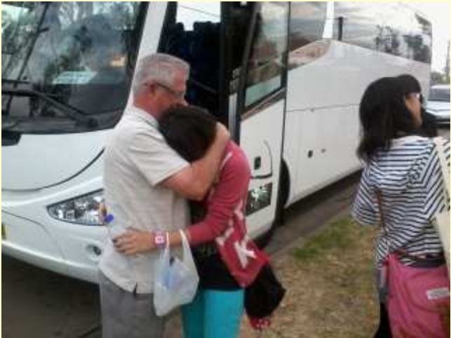
■187 ブルー・マウンテンズへ