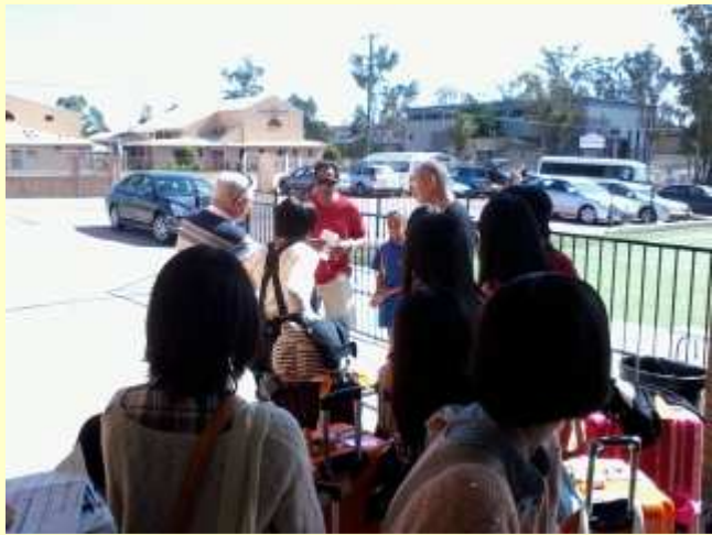
■50 ホスト・ファミリーとの対面 4