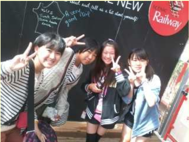
■191 トロッコは、4人1組で。