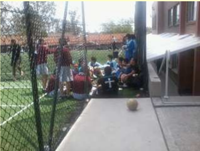
■128 お昼は、現地校の生徒と。