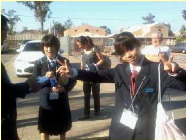
■58 生徒登校 4