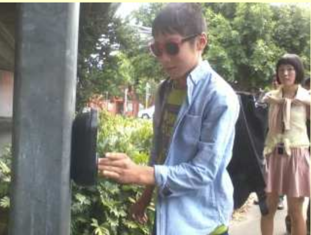
■216 横断歩道のボタンをおす。