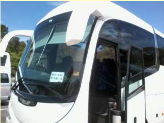
■215 フィッシュ・マーケットへ！