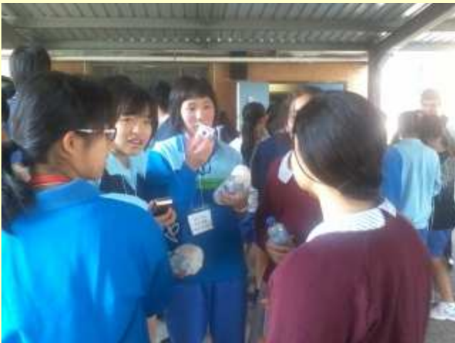
■127 お昼は、現地校の生徒と。