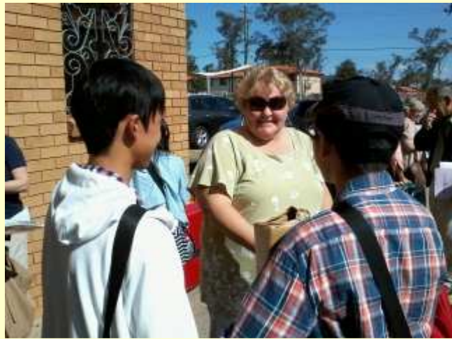
■51 ホスト・ファミリーとの対面 5