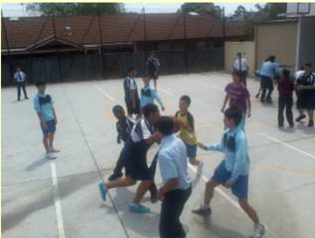
■131 お昼は、現地校の生徒と。