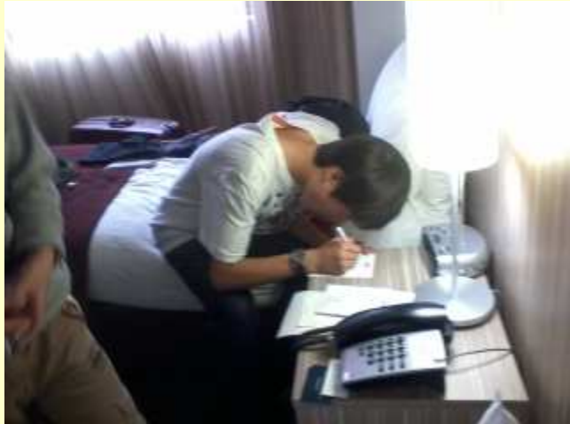
■230 手紙を書いている、心温まるシーン。