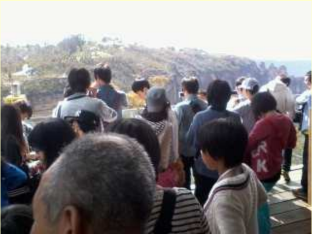
■188 ブルー・マウンテンズ到着