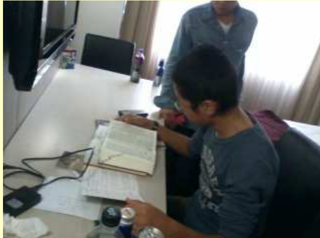
■231 ホスト・ファミリーの手紙を訳している感動的なシーン。