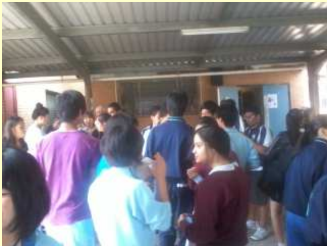
■125 お昼は、現地校の生徒と。