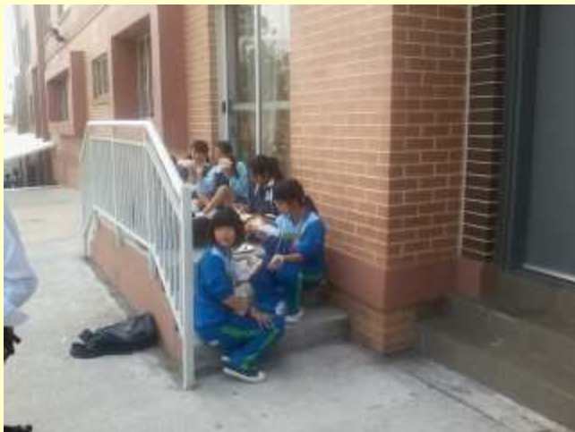
■129 お昼は、現地校の生徒と。