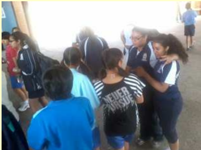
■126 お昼は、現地校の生徒と。