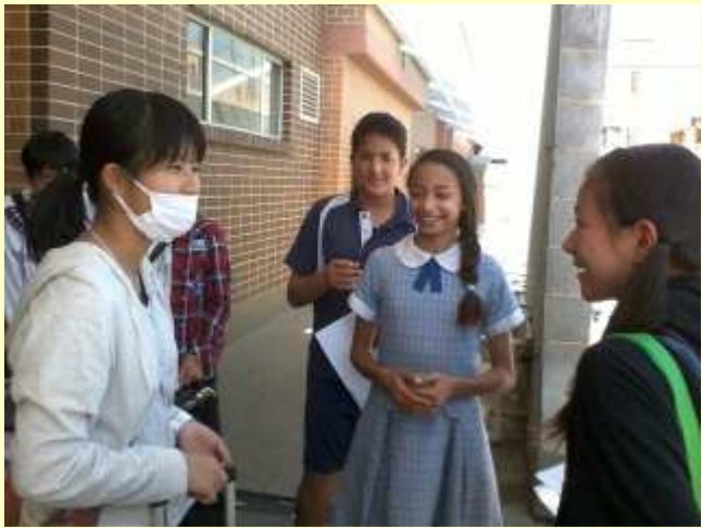
■49 ホスト・ファミリーとの対面 2