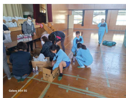
生徒が防災訓練参加