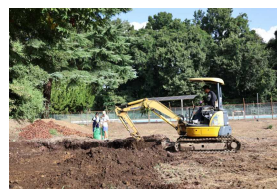
落ち葉を捨てる穴堀