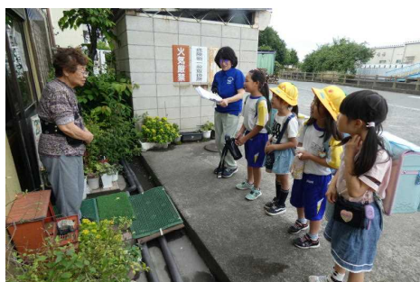
こども110番の家訪問