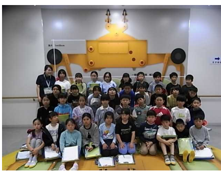
4年エコステーション見学