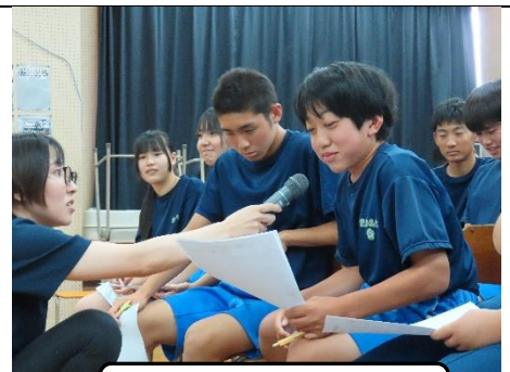
話し合った結果を発表

本年度より、「各種たより」は、ホームページに掲載すると同時にeメッセージにて配信いたします。紙面での配布は、今年度は行いますが、来年度よりホームページ、eメッセージのみの配信といたしますのでご了承ください。