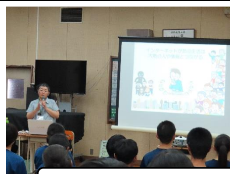
ネットの利用の仕方について、注意すべきことがわかりました

夏休みに向けて、ネットに関連した問題に触れることで、安全な夏休みを過ごせるとよいと思います。保護者の皆様も別室で聴講しました。