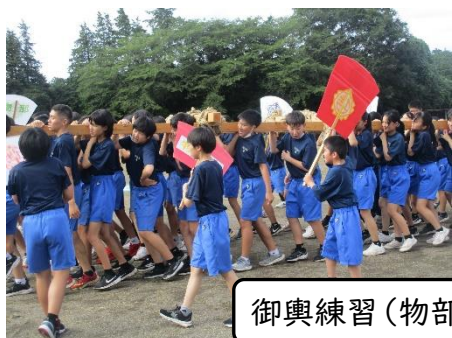
御輿練習（物部中学校にて）