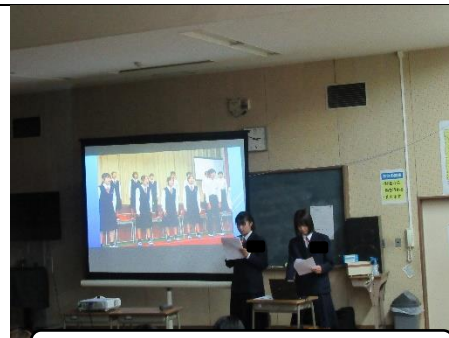
学校行事もいろいろあります

本年度より、「各種たより」は、ホームページに掲載すると同時にeメッセージにて配信いたします。紙面での配布は、今年度は行いますが、来年度よりホームページ、eメッセージのみの配信といたしますのでご了承ください。