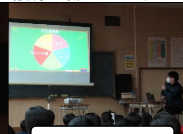
健康増進課の説明