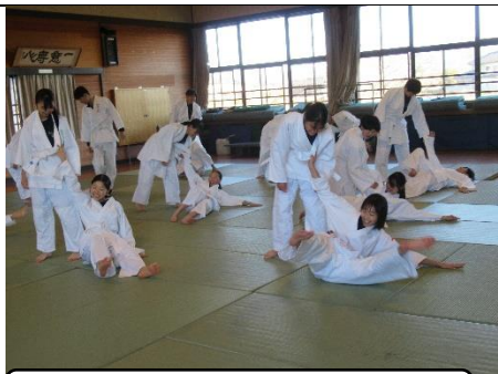
授業参観(保健体育)

1月13日(火)に中学校説明会が行われました。各学年の授業参観、中学校の生活や学習について、学校行事等の説明、部活動見学を実施しました。今回から、説明等はすべて生徒会役員が行い、立派に説明することができました。