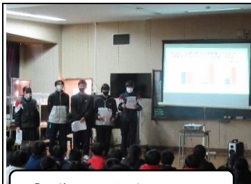
「野菜不足の解消」について