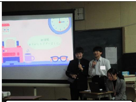
生徒会役員が説明しました