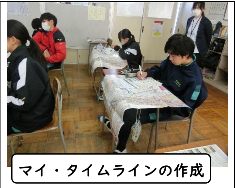
マイ・タイムラインの作成