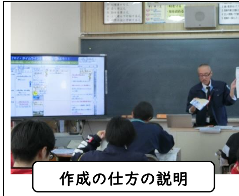
作成の仕方の説明