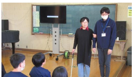
1年生：アイマスク体験

◇福祉体験◇ 11月28日（金）に真岡市社会福祉協議会の方を講師に、学年毎に福祉体験を行いました。アイマスク、車いす、点字など身体の不自由な方が、どう大変なのか体験することで、思いやりや気配りの大切さを実感することができました。