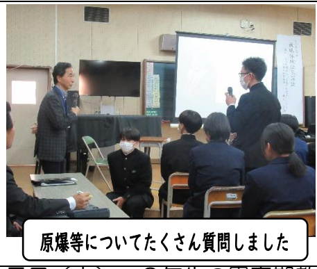
原爆等についてたくさん質問しました