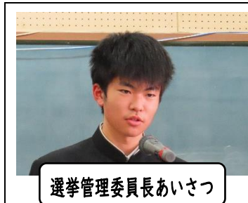
選挙管理委員長あいさつ