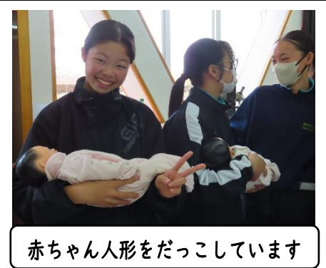
赤ちゃん人形をだっこしています