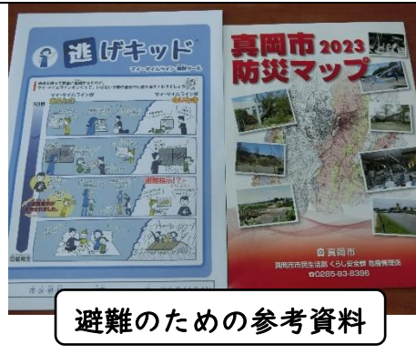
避難のための参考資料