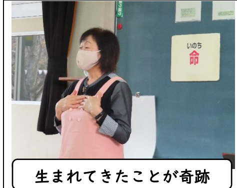
生まれてきたことが奇跡