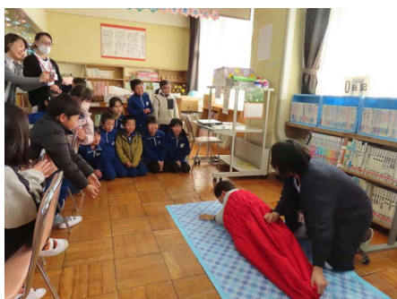
2年生「ぼくわたしのたんじょう」