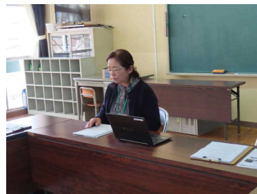
人権擁護委員様から

スマートフォンやタブレットは子供たちの身近なツールですが、使い方を誤れば大きな事件やトラブルに巻き込まれてしまう危険性を常にはらんでいます。今回の講演会で学んだ正しい知識と対処法を忘れず、御家庭でも今一度ルールを確認するなどして、安全に活用できるよう学校と家庭で見守っていききたいと思います。