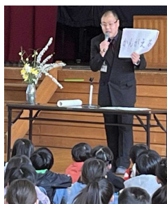
【児童指導主任の話】

つぎは、新1年生との約束の話です。入学式では、1年生と2つのことを約束しました。「進んであいさつをしよう」、「話をよく聞こう」の2つです。上級生は他喜力を発揮して、入学してくる1年生によい手本を見せましょうと結びました。