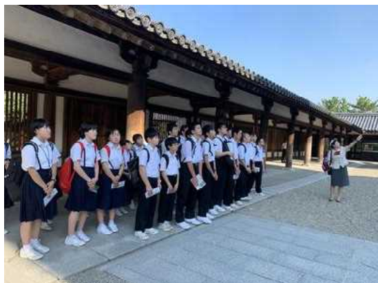
法隆寺でガイドさんの説明を聞く3年生

また、3年生は『日本の原点で学ぶ 美・食・文化』のスローガンどおりに、今まで写真や映像でしか見たことのなかった建築物や文化財を目の当たりにしたり、関西地方の文化に触れたりする体験をしてきました。これを機会に、今まで以上に視野を広げていろいろな物に興味・関心をもつことができるよう期待しています。