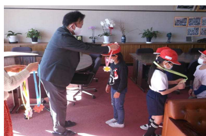
12/15 モリモリ給食表彰式