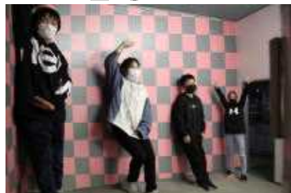
12/6 5年生 社会科見学