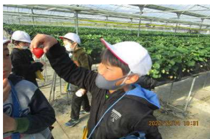
12/14 3年生 社会科見学