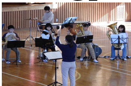
11/24 昼休みコンサート