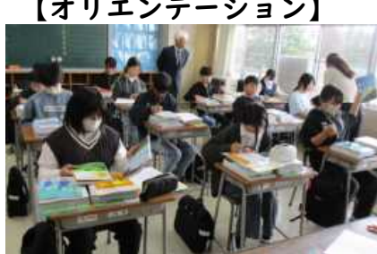
【オリエンテーション】