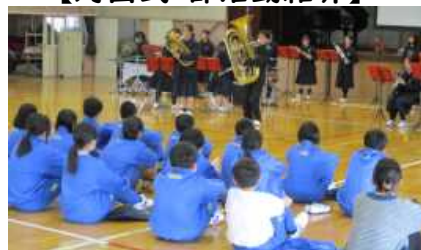
【対面式・部活動紹介】